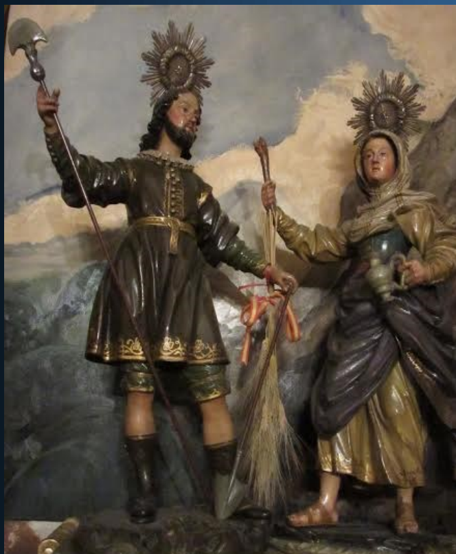
SAN ISIDRO Y SANTA MARÍA DE LA CABEZA

CAPILLA DE LA CUADRA REAL CONGREGACIÓN DE SAN ISIDRO DE NATURALES DE MADRID